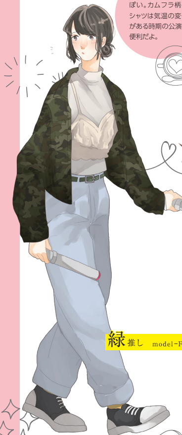
緑 推し model-Forget me

シャツとデニムのすっきりコーデ。フリルの襟を追加してキュートに仕上げたよ。赤を差し色に!