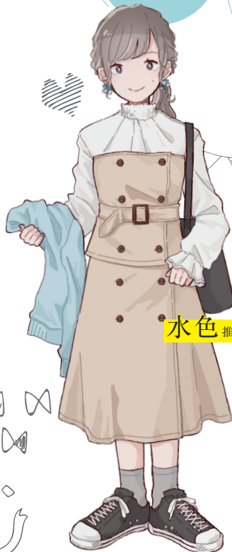
水色 推し model-KIMAGURE Prima donna