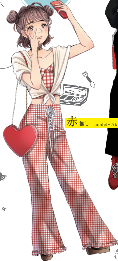
赤 推し model-Akane